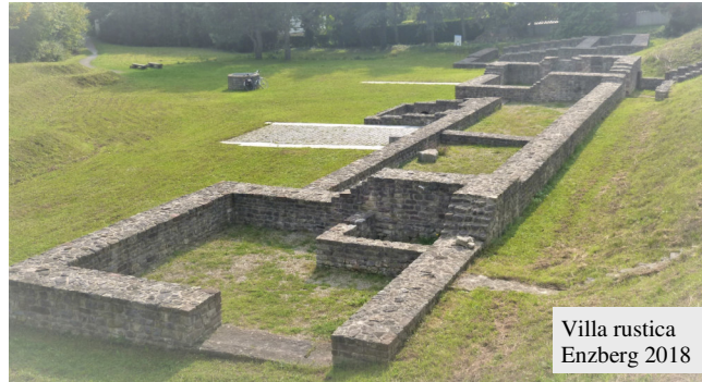
Villa rustica Enzberg 2018

Der Verein wurde im Herbst 1999 gegründet. Ausschlag gebend war die Ausgrabung einer gut erhaltenen Villa rustica in Mühlacker-Enzberg, deren sichtbare Erhaltung das erste Vereinsziel sein sollte.