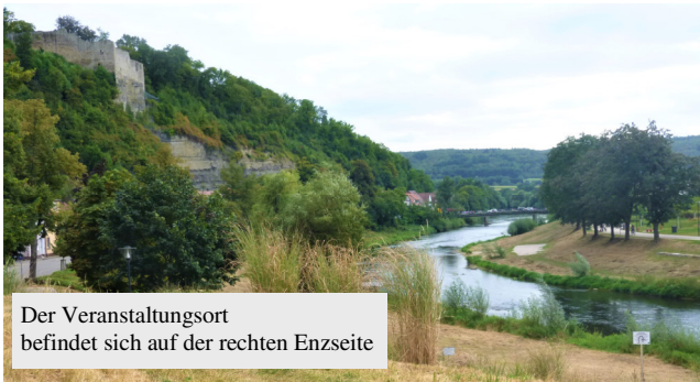
Der Veranstaltungsort befindet sich auf der rechten Enzseite